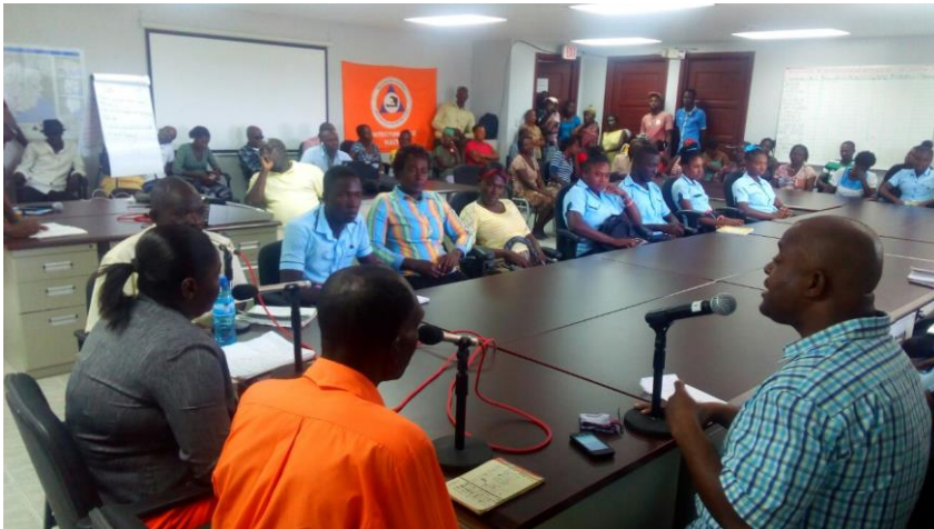
Emission foraine - section communale de Fonfrede, à 5 km des Cayes

Les émissions foraines sont diffusées sous 48 heures sur MINUSTAH FM dans « La Vie dans la Cité » à 4hres pm le lendemain et 5hres am le surlendemain.