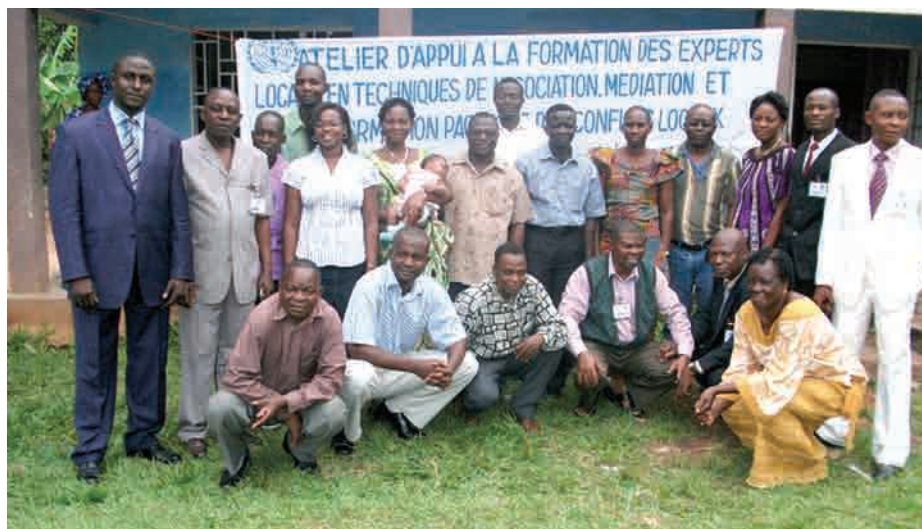
Experts locaux formés à Mbuji Mayi (Kasai Oriental)

Pour l'année 2012, les Affaires civiles de la MONUSCO envisagent de faciliter l'organisation de 20 ateliers dans 10 provinces afin d'assister les autorités congolaises pour la résolution des conflits prioritaires identifiés après "priorisation" de ceux-ci. Cette approche méthodique des Affaires civiles servira sûrement de base pour la mise en œuvre du Programme pour la Consolidation de la Paix. ■