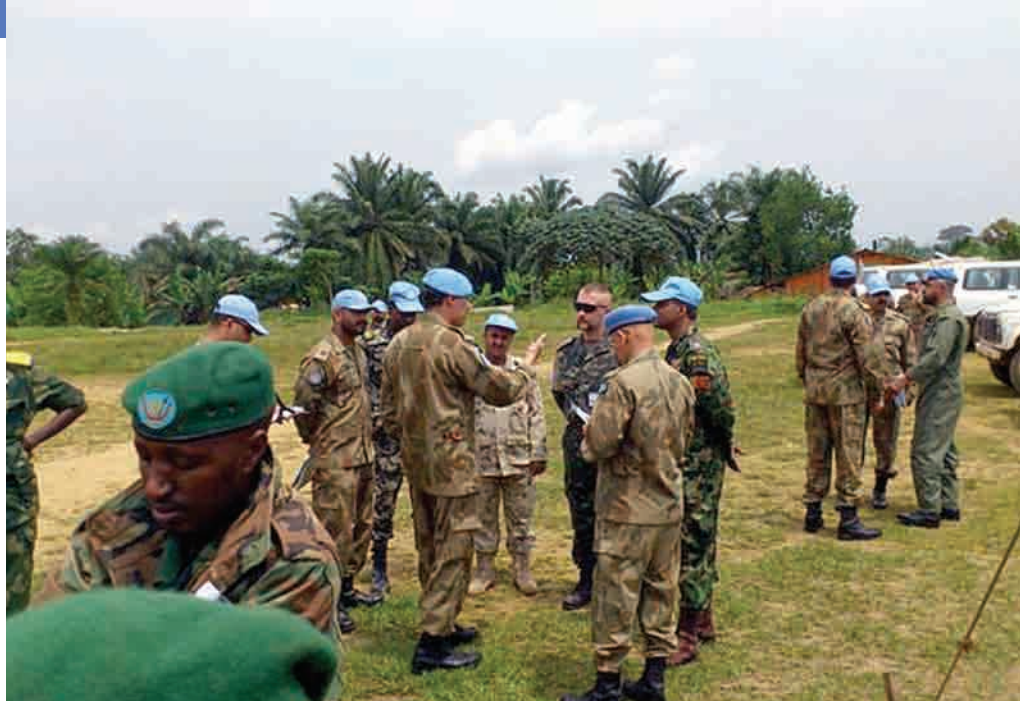
Casques bleus et éléments FARDC en discussion

C'est à l'issue de toutes ces actions que le commandant de la Brigade du Sud Kivu et la hiérarchie FARDC ont entamé des discussions qui ont abouti à la décision de mener une opération militaire conjointe contre les FDLR. Toutefois, cette opération ne sera mise en œuvre