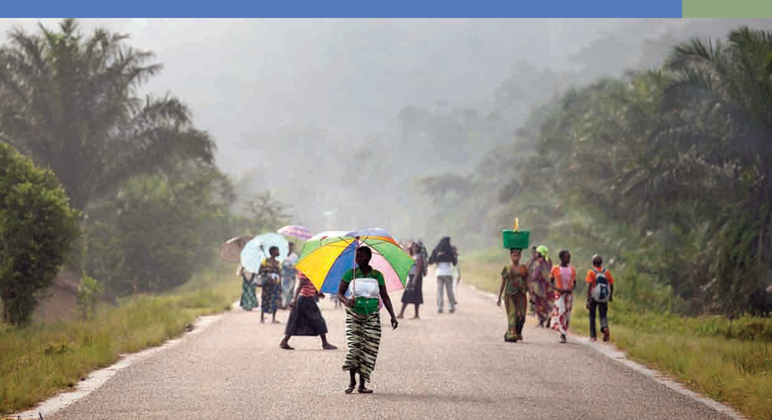
Des femmes déferlent l'artère principale d'une localité du Nord Kivu

assainissement sont énormes pour les populations vulnérables.