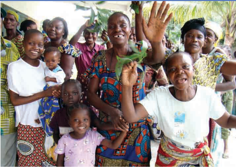
Femmes rurales en liesse - Photo d'archives

En outre, la MONUSCO a produit divers supports didactiques pour les femmes et les hommes vivant en milieu rural. A cet égard, le Bureau Genre a servi de catalyseur pour identifier les besoins spécifiques des femmes vivant en milieu rural, et parmi lesquels les besoins en vêtements, l'accès à l'information, les formations en matière de plaider en faveur de leurs droits. En 2009 et 2010, le Bureau Genre a fait confectionner 1000 pages sensibilisateurs comportant des messages pertinents (en langues locales) sur les types de violences commises contre les femmes, spécifiquement dans les zones rurales, et les bases légales pour prévenir et répondre à ces crimes. Ces pages ont été largement utilisés par les formateurs -- tant au sein de la MONUSCO qu'à l'extérieur -- pour sensibiliser les femmes rurales sur leurs droits. Ils ont été portés avec fierté aussi bien par les femmes que par les hommes congolais afin de transmettre les messages véhiculés à leurs familles, collègues, voisins, etc.