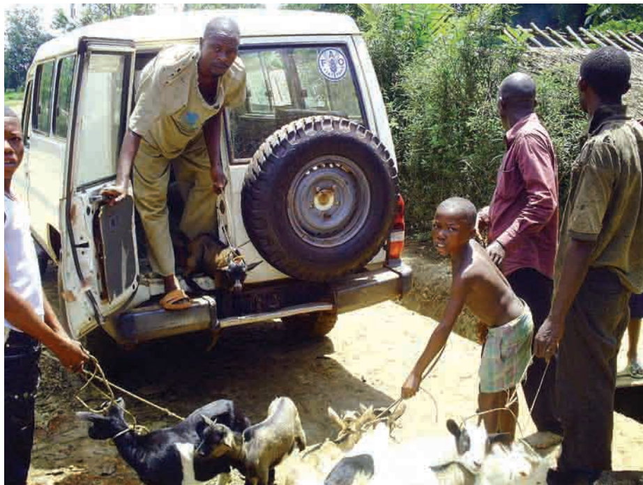
Appui de la FAO aux démobilisés à M'bandaka

Le choléra a, d'ailleurs, frappé la province de plein fouet en 2011, touchant pas moins de 31 Zones de santé sur les 69 que compte la province. A ce jour, un peu plus de 3 040 cas de l'épidémie dont 163 décès ont été enregistrés. Le Fonds des Nations Unies pour l'Enfance (Unicef) et l'Organisation mondiale de la santé (OMS) accompagnées des ONG nationales et internationales partenaires ont dû apporter leur soutien aux autorités sanitaires provinciales dans la mise en