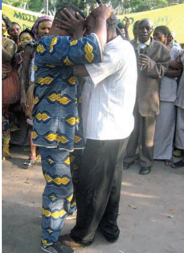
Accolade entre deux chefs de villages

Le Bureau des Affaires civiles de la Mission de l'Organisation des Nations Unies pour la Stabilisation en République démocratique du Congo (MONUSCO) est l'un des services organiques de la mission. Dans le but de contribuer à la mise en place de conditions favorables pour la stabilisation et la consolidation de la paix en République démocratique du Congo (RDC), et conformément à son mandat, cette section met en œuvre des activités d'appui, aussi bien aux autorités congolaises qu'à la société civile, pour la résolution des conflits et la réconciliation communautaire sur l'ensemble du territoire national.