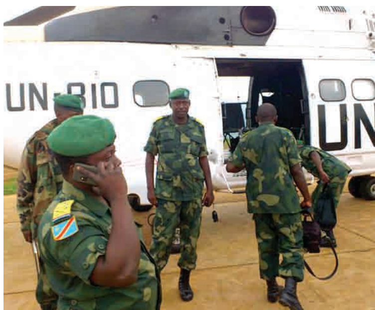
Des soldats FARDC s'appêtent pour une patrouille conjointe avec la Force de la MONUSCO

notamment de Ngolombe, Mugadilo, Kwantamba et Luyuyu. Près de 2500 personnes sont arrivées à Nindja, entre