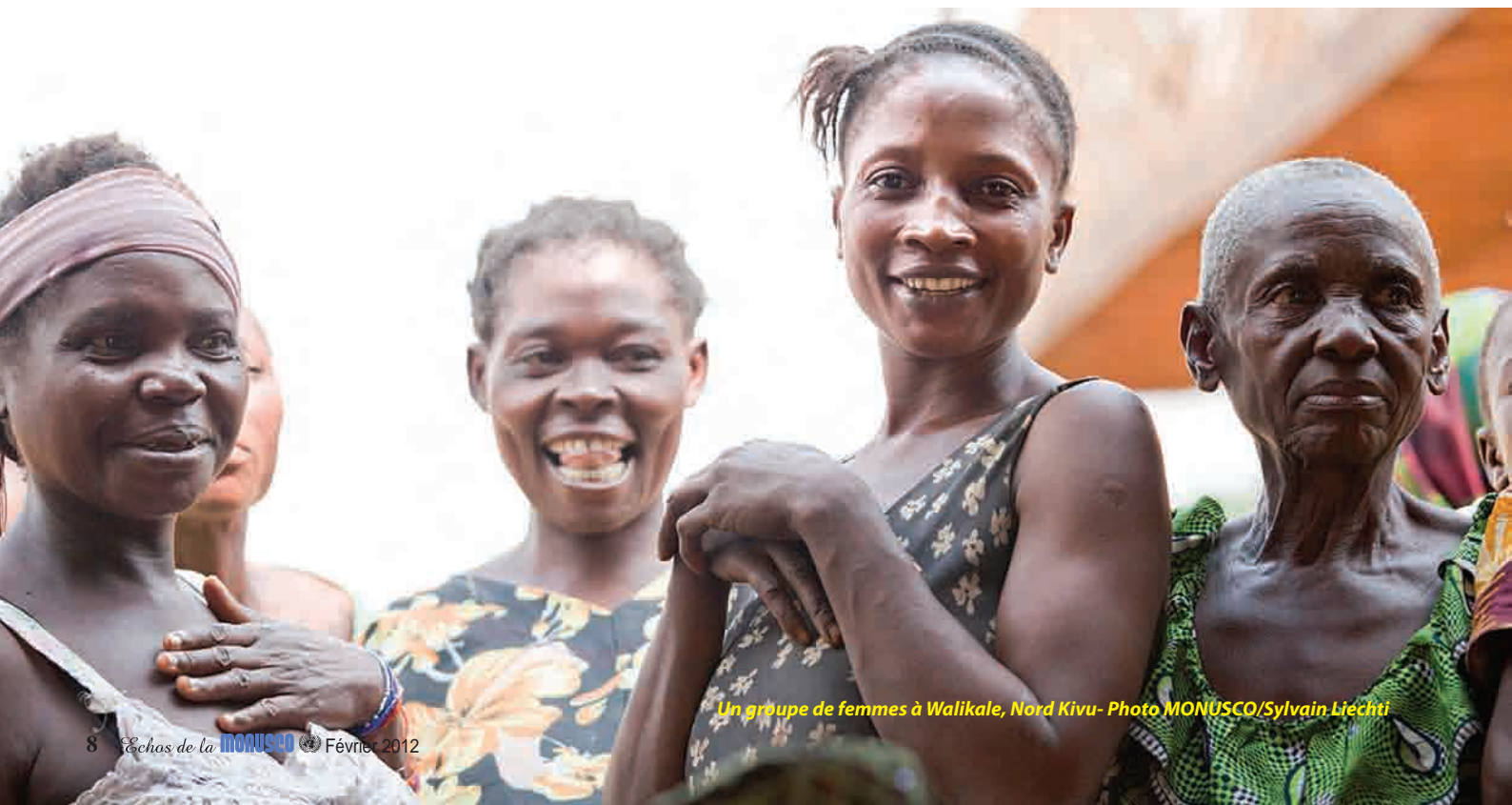
Un groupe de femmes à Walikale, Nord Kivu - Photo MONUSCO/Sylvain Liéchti

Pour OCHA et ses partenaires, les priorités humanitaires dans ces zones dépendent des besoins des populations et de leur emplacement. Dans certains endroits, ce sont des vivres ou des biens non-alimentaires, tandis que dans d’autres, les besoins en eau et en