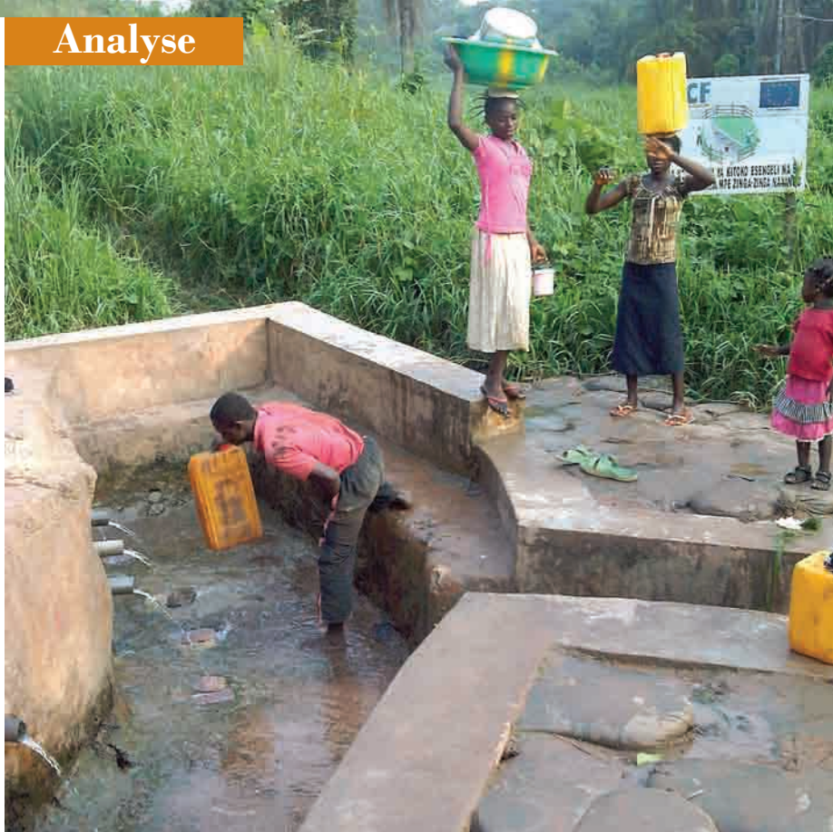
Point d'eau aménagé par l'ONG Action contre la Faim à Dongo

La situation humanitaire de la RD Congo à l'image de celle de l'Equateur