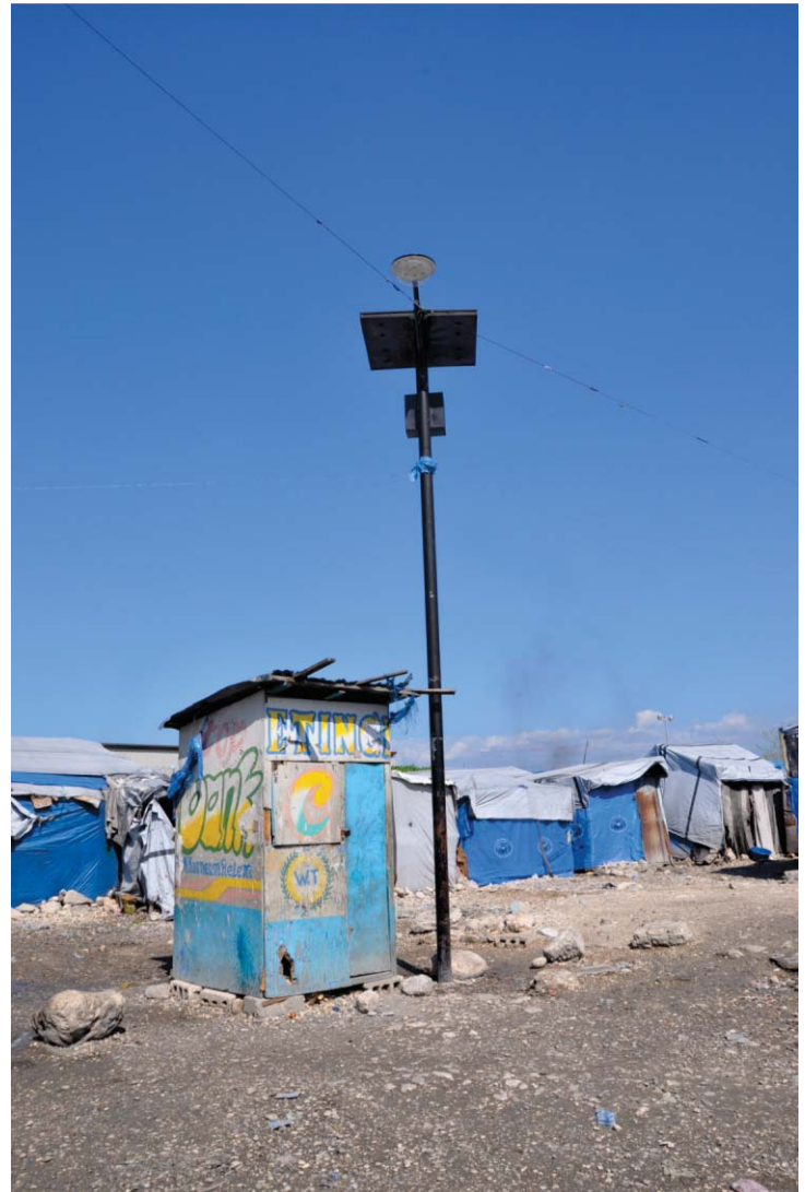
Adequate and strategic lighting was installed around public washroom.