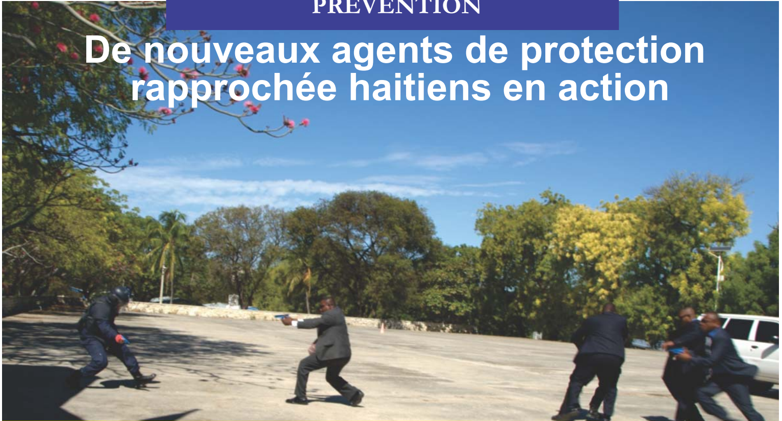
Nouveaux agents de protection rapprochée en action lors d'un scénario de formation.