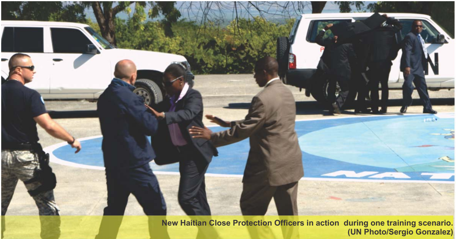
New Haitian Close Protection Officers in action during one training scenario.

Defossez describes the skills needed to serve as a Close Protection Officer as “intelligent, efficient, professional and knowledge of what weapons to use and when to use them.” The types of VIPs that these officers will protect may very well include the Prime Minister and his family.