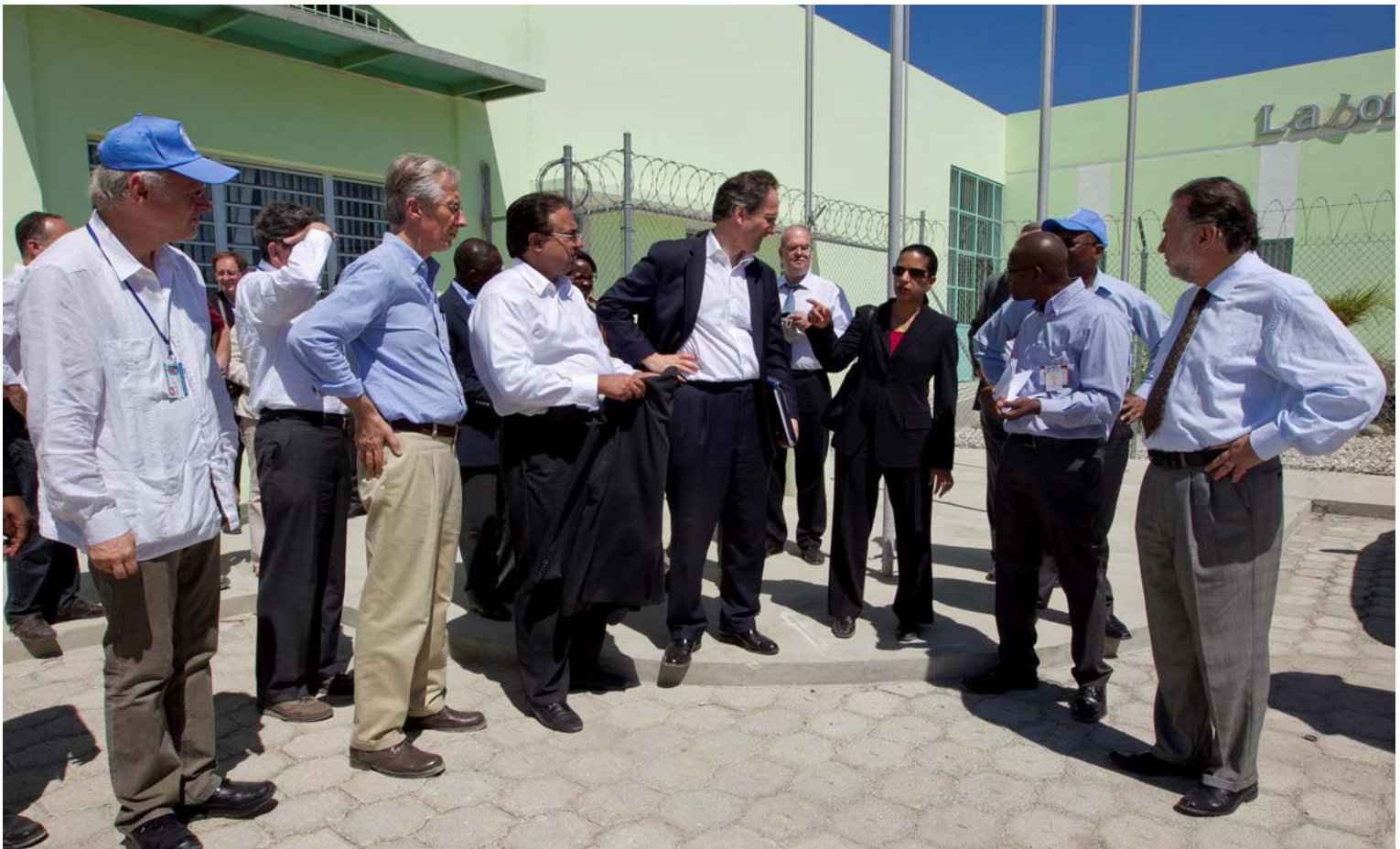
Members of the United Nations Security Council and members of the MINUSTAH visit a cholera treatment center in Port-au-Prince