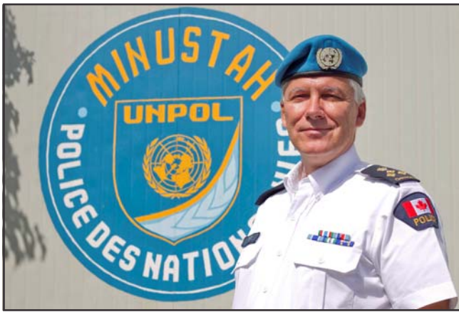
Marc Tardif Police Commissioner / Commissaire de Police