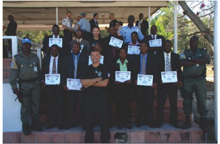
Group of PNH who received certificates of recognition and attendance, eight of whom have completed training as Close Protection Unit.

According to UNPol Laurent Defossez, who is assigned to the UNPol-HNP Development Police component,