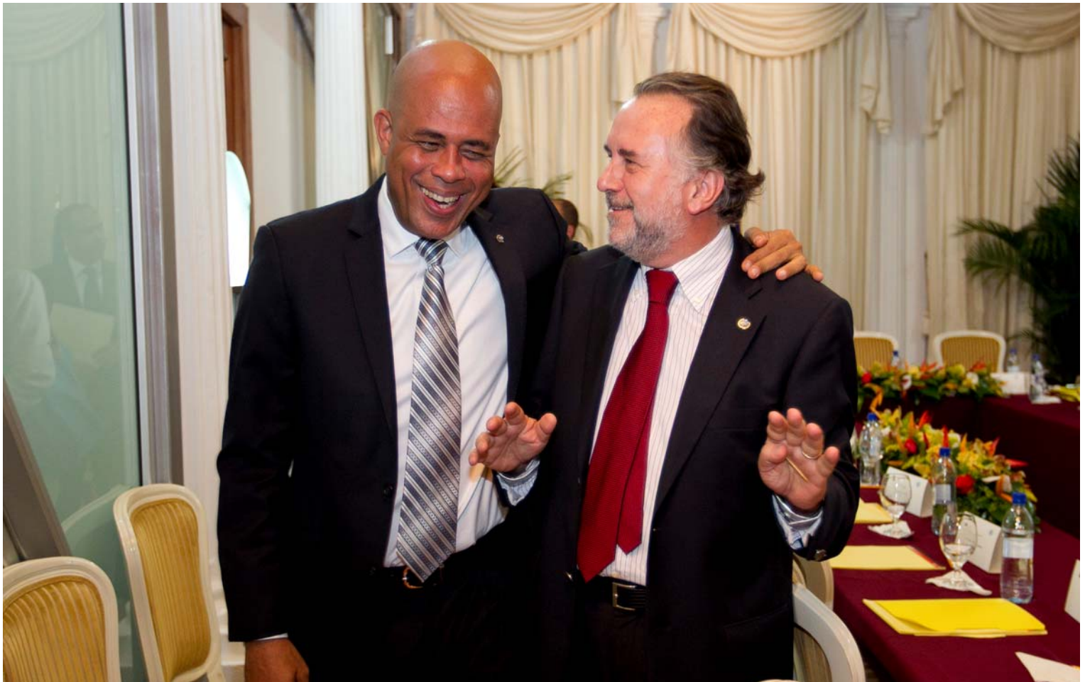
Le Chef de la Mission des Nations Unies en Haïti (MINUSTAH), M. Mariano Fernandez discute avec le président haïtien M. Michel Martelly.