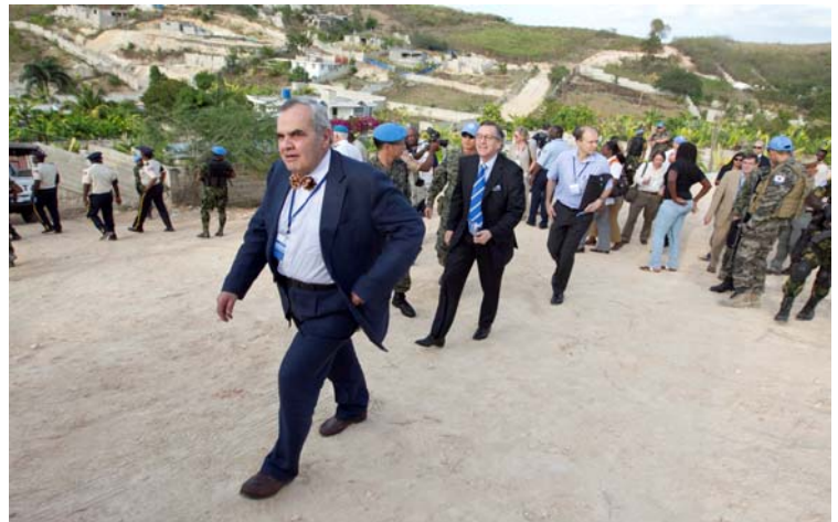
Members of the Security Council visited a Korean Engineering Battalion residential housing construction project site in Leogane on February 14, 2012..

The final day's events began at the HNP Academy where the dignitaries received briefings regarding the current state of HNP training activities. UNPol Cecile Valved additionally gave a briefing concerning the training aspects of HNP Sexual and Gender Based Violence (SGBV). The briefing was followed by a question and answer session, after which the dignitaries conducted a brief tour of temporary classroom construction before moving onto the Internally Displaced Person Camp (IDP) located at Carradeux.