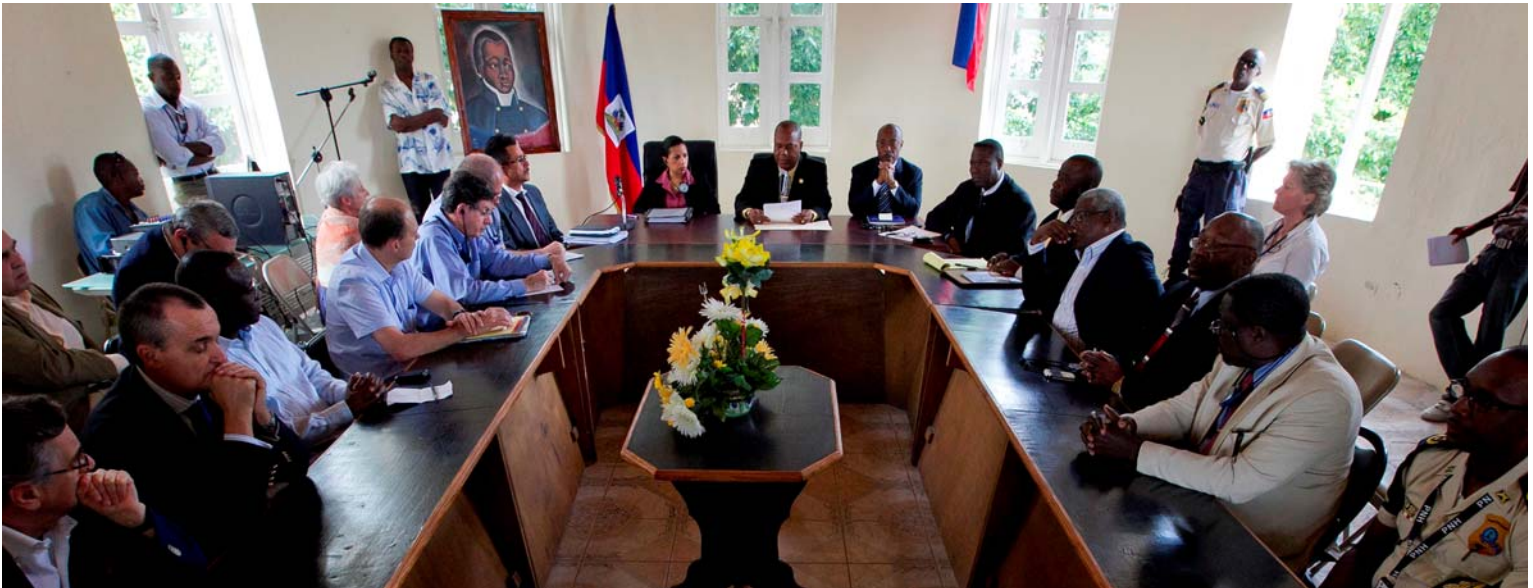
Le Conseil de sécurité des Nations Unies a visité la ville du nord d'Haïti de Cap-Haïtien lors de leur tournée de quatre jours en Haïti.

Par: Billy Young / MINUSTAH-UNPol Journalist