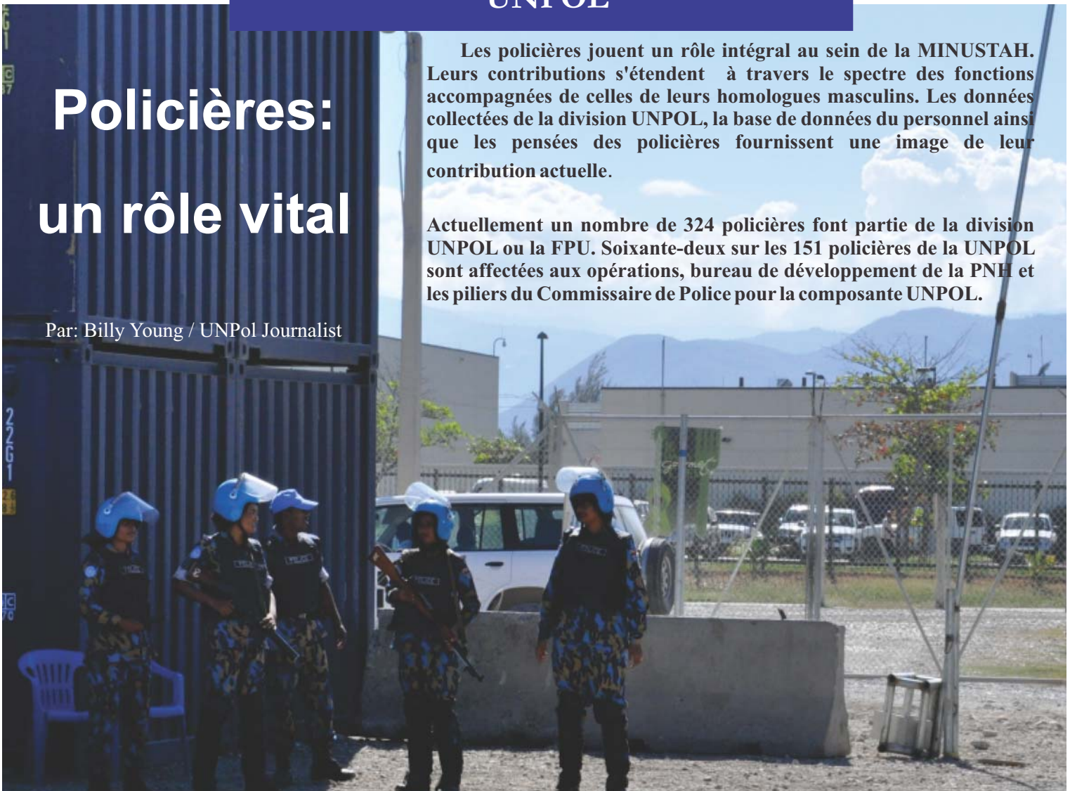
Bangladesh FPU 2 en opération à un point de contrôle.

Actuellement un nombre de 324 policières font partie de la division UNPOL ou la FPU. Soixante-deux sur les 151 policières de la UNPOL sont affectées aux opérations, bureau de développement de la PNH et les piliers du Commissaire de Police pour la composante UNPOL.