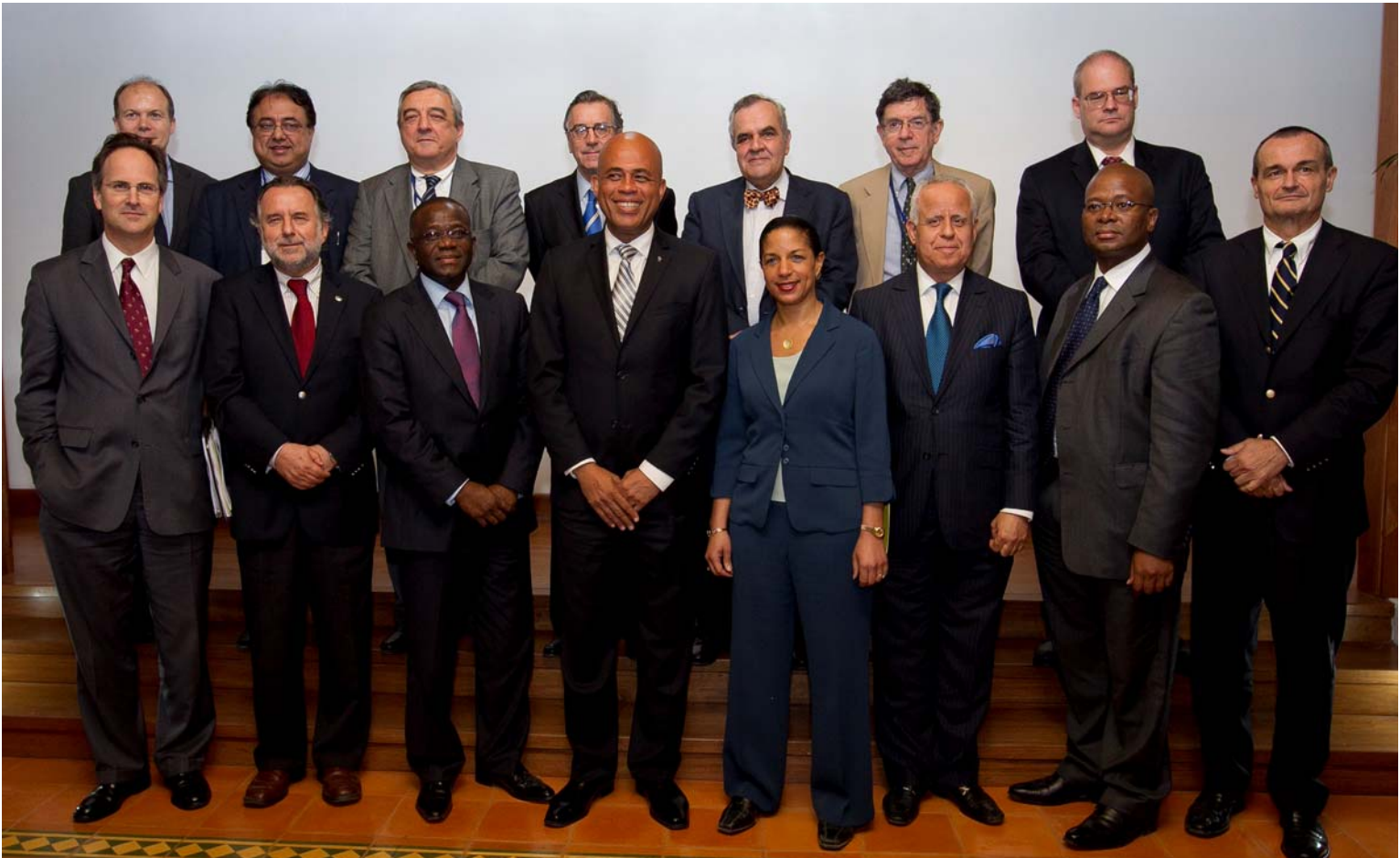
Members of the United Nations Security Council met with the Haitian Presidente Michel Martelly at the heavily damaged National Palace in Port-au-Prince during their 4 day tour of the country.

By: Billy Young / MINUSTAH-UNPol Journalist