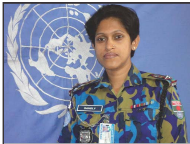
Lt. Col. Sahely Ferdous Commandant - BANFPU2

Les femmes policières sont une composante vitale pour la mission de la Police de la MINUSTAH et leur effectif est très important. La relation entre les femmes UNPOL et FPU est étroite, elles se supportent mutuellement et ainsi s'entraident en tant que force multiplicatrice pour l'édification de chacune. On doit leur féliciter pour leurs efforts. ■